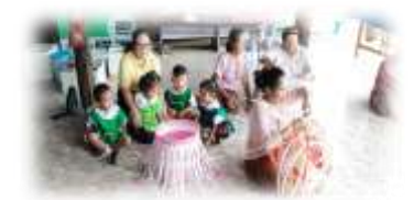
ภูมิปัญญาท้องถิ่น (ด้านการจักสานตะกร้าพลาสติก)