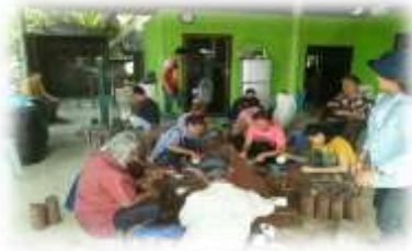
ภูมิปัญญาท้องถิ่น (ด้านการทำปุ๋ยหมักชีวภาพ)